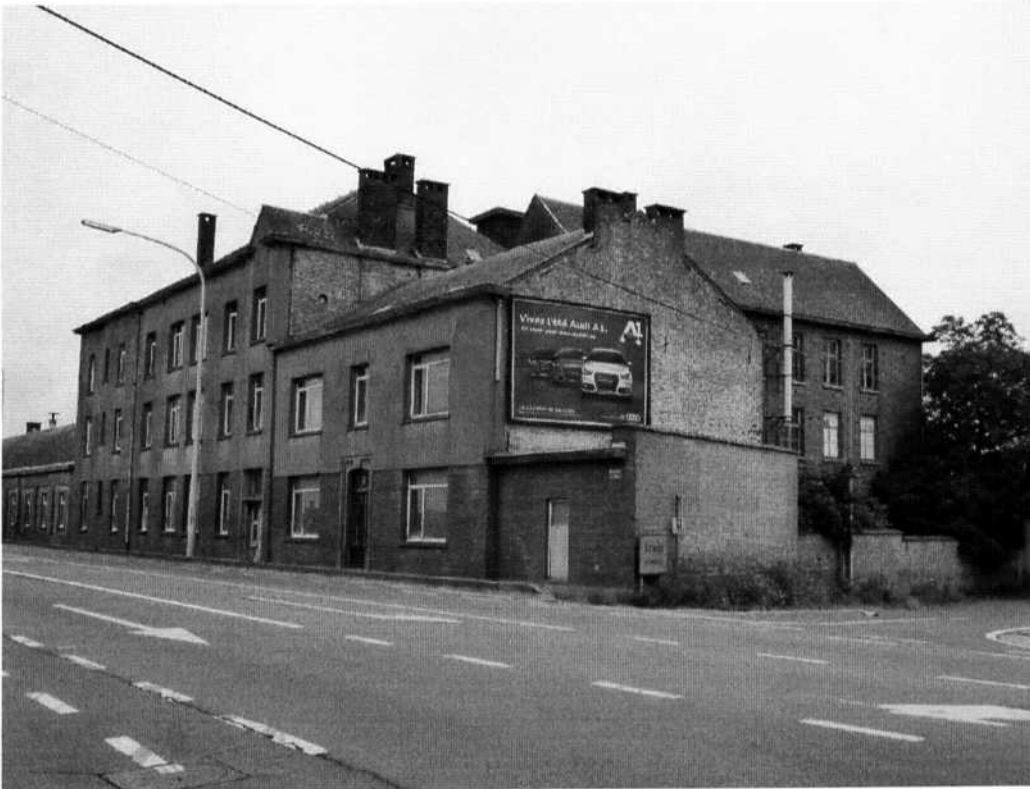
Vue de la chée de Wavre

NB : avis de la Direction des Routes de Namur :